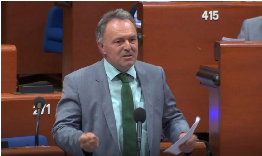
Un élu résolument positif !

D'autres intervenants ont pris le micro pour évoquer des situations délicates similaires ailleurs, comme entre l'Allemagne et la Hollande, avec les travailleurs saisonniers qui viennent de l'Est.