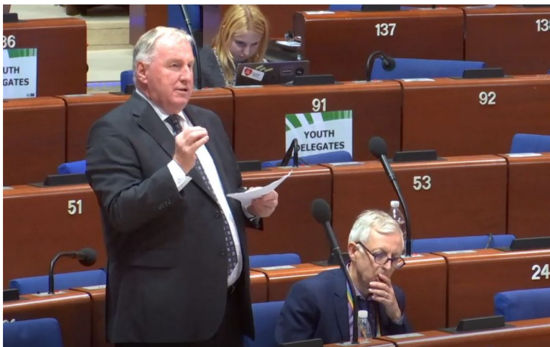
Karl-Heinz Lambertz

Cette recommandation est basée sur un rapport du Belge Karl-Heinz Lambertz, qui s’est lui-même appuyé sur une étude pilotée par l’Institute for Transnational and Euregional de Maastricht (ITEM).